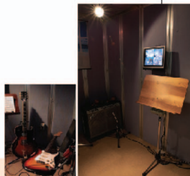
Solo Booth 遮音性能45dBのソロブース、広さ約3.5畳。