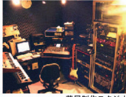
声屋制作スタジオ

カラオケ/着メロデータ、ゲーム音楽、各種効果音や効果音楽などMIDIデータの制作を承ります。制作には経験豊富なプロのアレンジャーやミュージシャンが携わります。