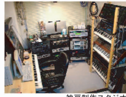
神戸制作スタジオ

T.V・Radio用シングルからC.Mイメージソング、サウンドロゴやゲーム音楽、各種イベント用オリジナルソングに至るまで、様々なニーズに答えたいします。インスト楽曲、唄入り、オリジナル作品の作詞・作曲・編曲またはそのアドバイスまで幅広く対応いたします。