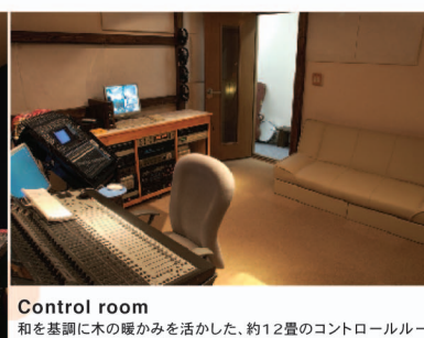
Control room 和を基調に木の暖かみを活かした、約12畳のコントロールルーム。